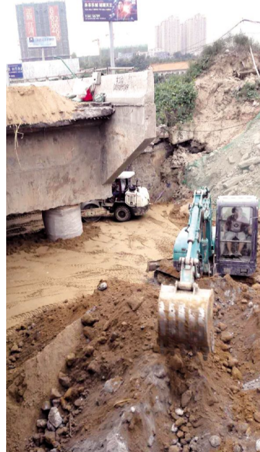
■ 养护公司 袁红